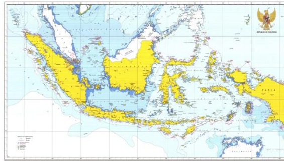
Gambar 2. Peta koordinat Geografis Titik-Titik Garis Pangkal Kepulauan Indonesia.