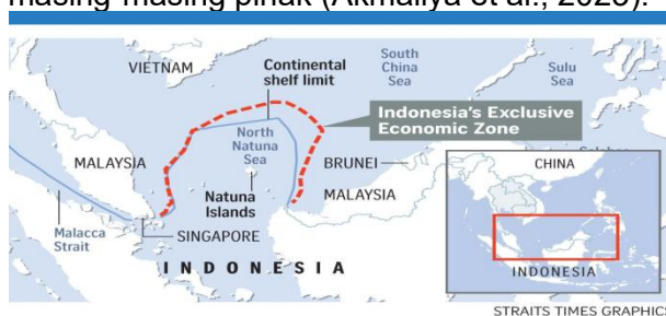
Gambar 7. Peta Zona Laut Kontinen dan Zona Ekonomi Eksklusif Indonesia

Ketegangan antara Indonesia dan Vietnam di Laut Natuna Utara berakar dari tumpang tindih Zona Ekonomi Eksklusif (ZEE) kedua negara. Konflik ini muncul karena baik Indonesia maupun Vietnam menarik garis ZEE sejauh 200 mil laut dari garis pangkal masing-masing. Namun, karena jarak antara kedua negara tidak mencapai 400 mil laut, terjadi tumpang tindih wilayah yang diklaim sebagai ZEE oleh masing-masing pihak (Akmaliya et al., 2023).