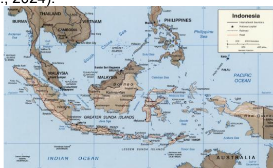
Gambar 1. Peta geografi Indonesia.

Kompleksitas geografi Indonesia yang terdiri dari lebih dari 17.000 pulau menjadikan isu delimitasi maritim sebagai tantangan geopolitik yang terus berkembang. Perbatasan darat Indonesia tersebar di tiga pulau besar dan mencakup 15 kabupaten/kota, sedangkan wilayah maritimnya ditandai oleh keberadaan 92 pulau terluar yang memiliki implikasi langsung terhadap keutuhan wilayah kedaulatan negara (Sodik, 2018). Dalam realitas tersebut, ketegangan dan konflik potensial dengan negara-negara tetangga seperti Malaysia, Vietnam, Filipina, hingga Tiongkok, semakin memperkuat urgensi penetapan batas-batas maritim yang sah dan terukur secara hukum (Akmaliya et al., 2023, Mega Jaya et al., 2024).