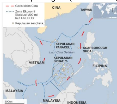
Gambar 10. Peta klaim nine dash line oleh Cina

dengan United Nations Convention on the Law of the Sea (UNCLOS) 1982, dan juga telah dinyatakan tidak memiliki dasar hukum oleh Permanent Court of Arbitration (PCA) dalam putusan tahun 2016 atas gugatan Filipina terhadap Tiongkok (Firdaus et al., 2023; Wisayantono et al., 2023).