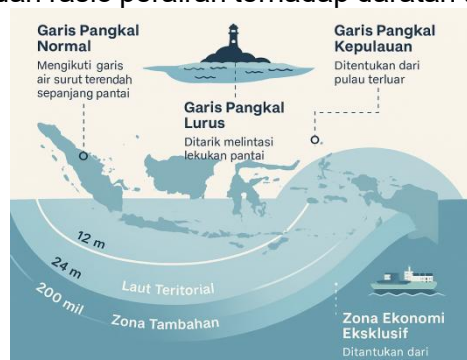
Gambar 3. Jenis-jenis Garis Pangkal dan Zona Maritim Indonesia.

Untuk kondisi geografis khusus seperti muara sungai, teluk, dan pelabuhan, negara pantai dapat menarik garis pangkal khusus (United Nations, 1982: Art, 9-11). Sementara itu, bagi negara kepulauan seperti Indonesia, Pasal 47 UNCLOS 1982 memperbolehkan penarikan garis pangkal kepulauan ( archipelagic baselines ) yang menghubungkan titik-titik terluar dari pulau-pulau dalam satu kesatuan kepulauan. Penarikan ini harus memenuhi persyaratan tertentu, seperti jarak antar titik tidak melebihi 100 mil laut dan rasio perairan terhadap daratan tidak lebih dari 9:1 (Djalal, 2014).