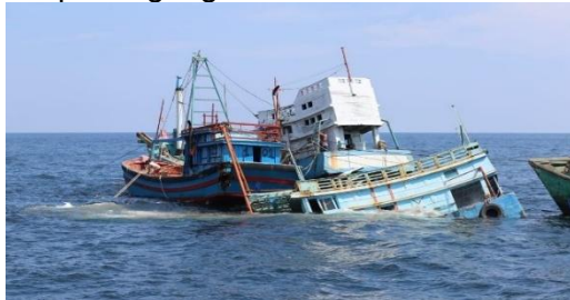
Gambar 9. Penerapan Kebijakan Sink the Vessel Indonesia atas Kapal-Kapal yang Terbukti Melakukan IUU Fishing .

Ketegangan ini bahkan pernah memicu insiden di lapangan, termasuk persinggungan antara kapal Penjaga Pantai Vietnam dan Kapal Perang Republik Indonesia (KRI) saat melakukan patroli di wilayah sengketa. Insiden tersebut menunjukkan betapa sensitif dan rentannya dinamika keamanan di perairan ini terhadap ketegangan militer terbuka.